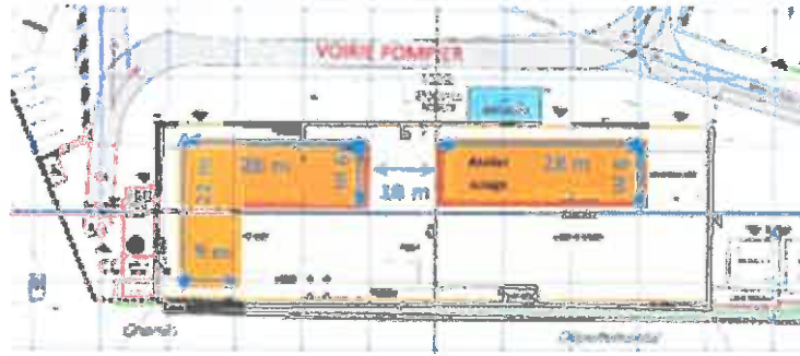
Figure n° 2 : plan de l'atelier « sciage » et limites de dimensionnement du stockage